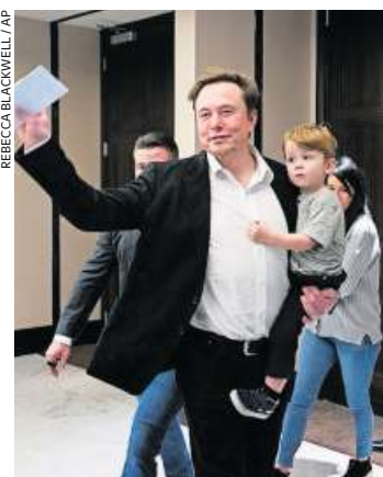
Elon Musk hat neun Kinder.

Elon Musk jedoch, der selbst Vater von neun Kindern ist, nutzt das Thema für fragwür-